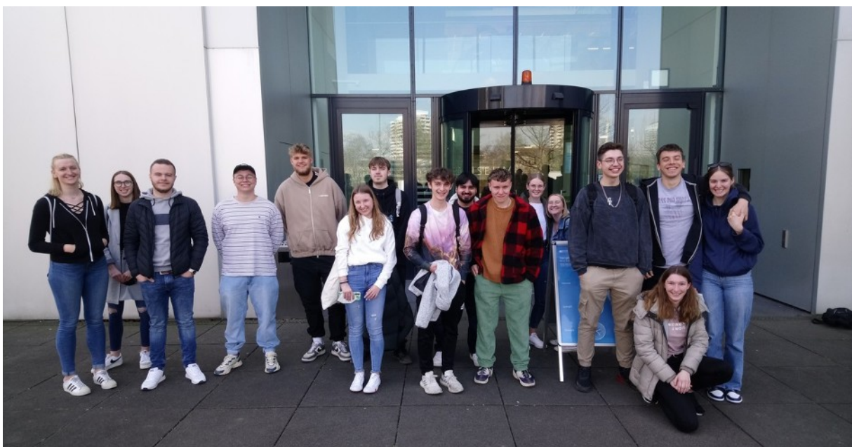
Der Kurs 03WILE5.