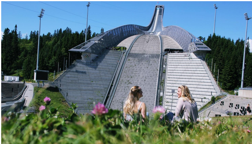
Wir am Holmenkollen in Oslo