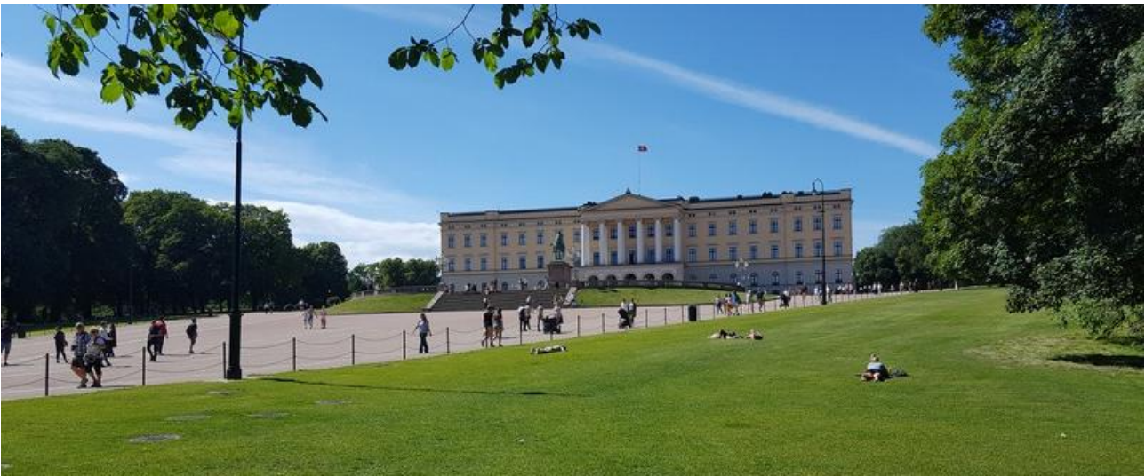
Königliches Schloss in Oslo