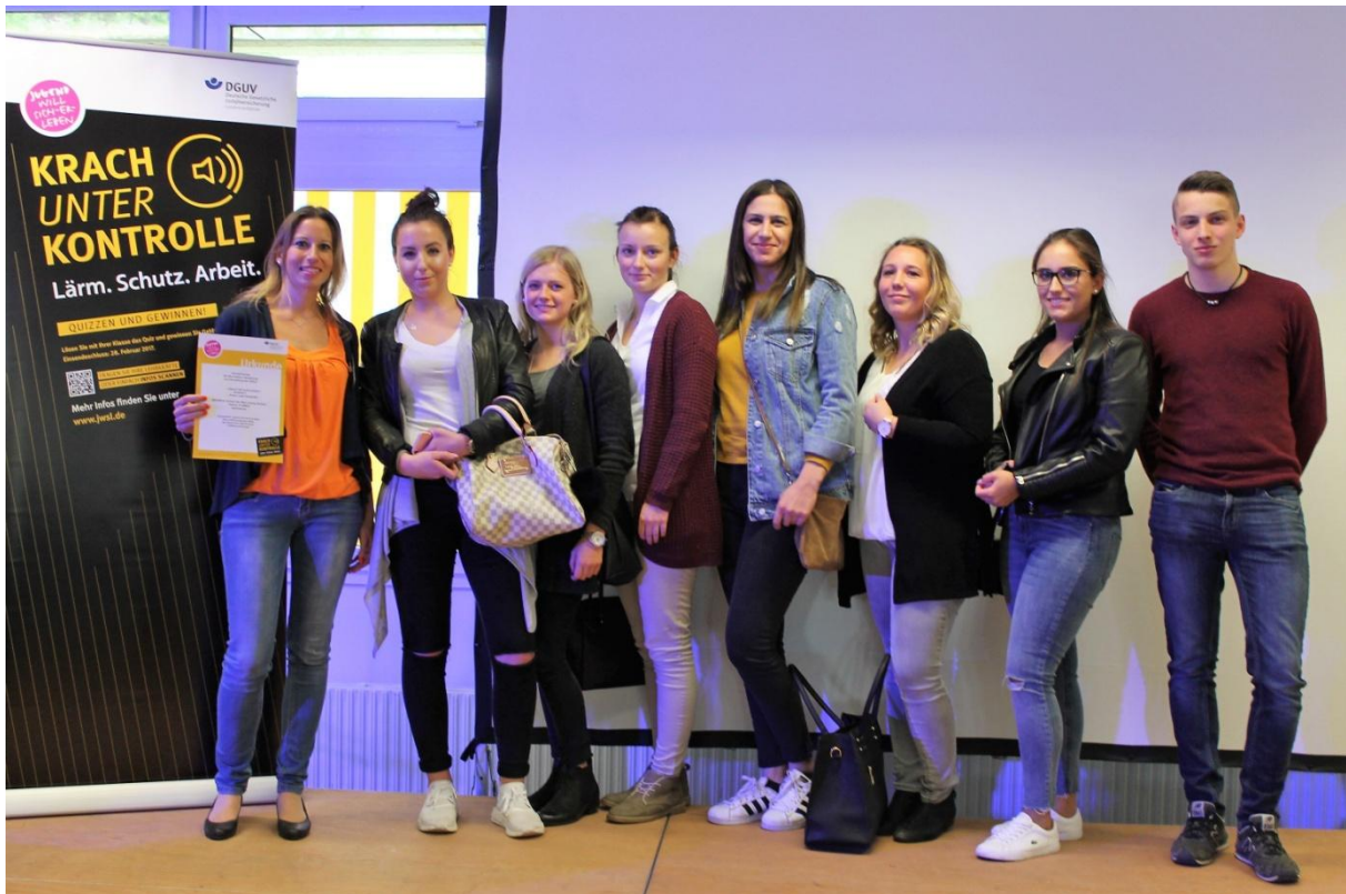
Die Klasse 10WBÜ2.

Für die intensive Auseinandersetzung mit dem Thema „Lärm“ und dessen Folgen wurden die angehenden Kaufleute für Büromanagement nun mit dem ersten Preis des Kreativpreises ausgezeichnet und erhielten zudem einen hohen Geldpreis.